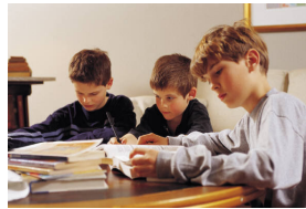
Title I-A focuses on the high standards expected of all children.

Each of the eleven Schoolwide Programs has its own decision-making process. Parents, community members, teachers, and other staff decide what steps are necessary to help all students meet high state standards. There is a great deal of local decision-making and flexibility in the Schoolwide Programs. Parents can request information regarding the highly qualified status of their child's teacher.